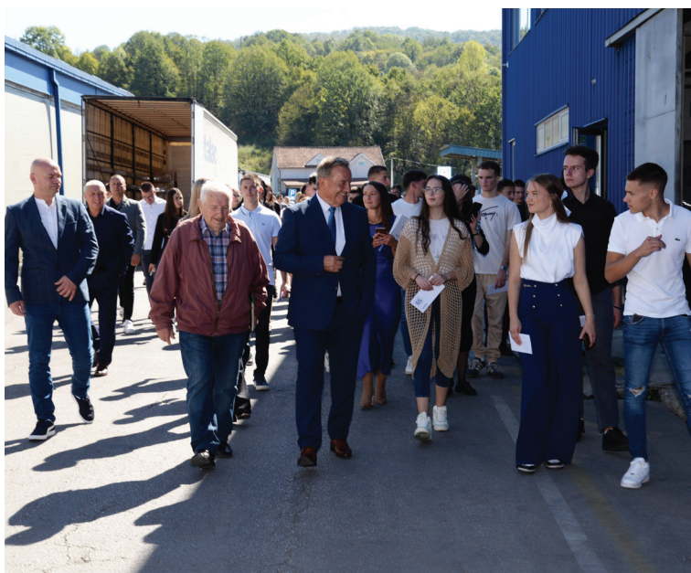
Ulice zaslužnim bivšim direktorima otkrivene u prisustvu članova njihovih porodica, rukovodstva kompanije i 36 momaka i devojaka, prvih Metalčevih beba koje su ove godine postale punoletne.